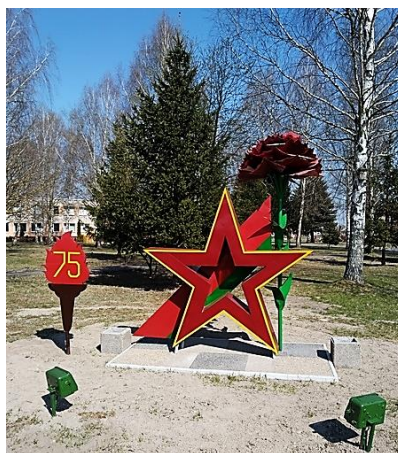
Арт-інсталяцыя «Вайна. Перамога. Памяць»

Арт-інсталяцыя на тэрыторыі школы, прысвечаная 75-годдзю Перамогі, нагадвае пра тых, каму мы ўдзячныя за мірнае неба над галавой.