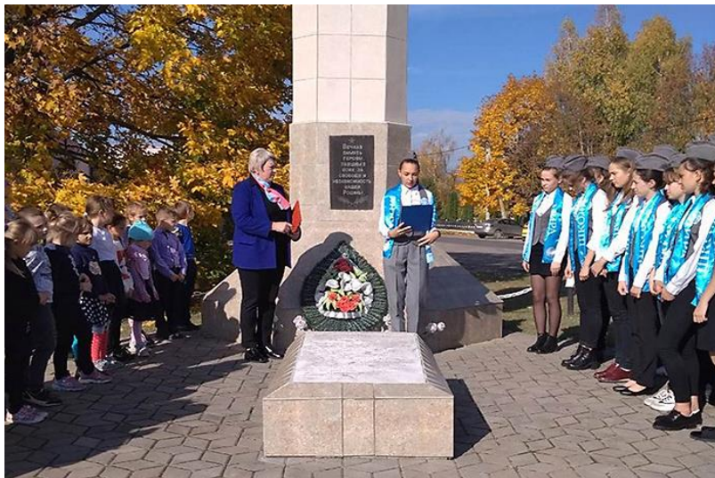
Вучні Астроміцкай СШ на ўрачыстым мітынгу каля брацкай магілы

З атрыманнем ганаровага статусу работа па патрыятычным выхаванні ў школе пашырылася. У рамках акцыі «Во славу общей Победы» прайшло ўрачыстае мерапрыемства па заборы зямлі з брацкай магілы ў Астромічах для далейшай яе перадачы ў храм-помнік усіх Святых у Мінску.